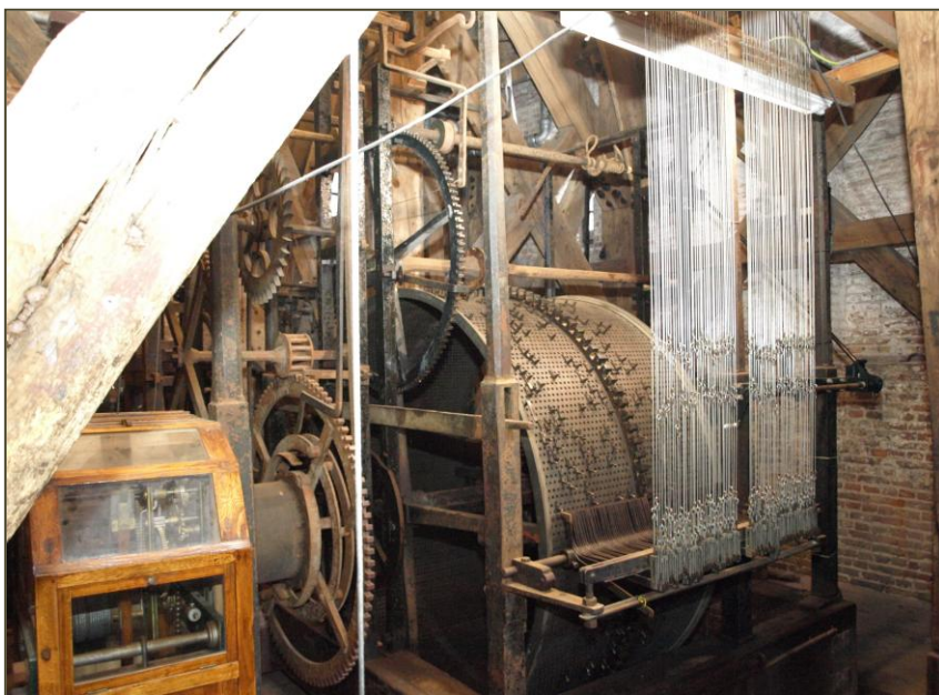
De speeltrommel van de Zuidertoren

Sinds de 17 e eeuw wordt dag en nacht elk kwartier de tijd aangegeven door de melodieën van beide carillons, voortgebracht door de 17 e -eeuwse speeltrommels van zowel de Zuidertoren als de Drommedaris.